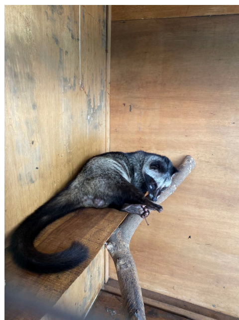
【バリ島 コーヒー農園のジャコウネコ】