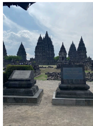
【ジャワ島 プランバナ寺院群】

※ゆうちょ銀行の総合口座をお持ちの場合、ゆうちょ ATM、ゆうちょダイレクトからゆうちょ銀行の総合口座への振り替え（口座間送金）には手数料がかかりませんので、ゆうちょ銀行振込をご利用ください。